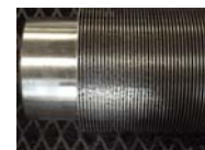
Welded Fin Tube